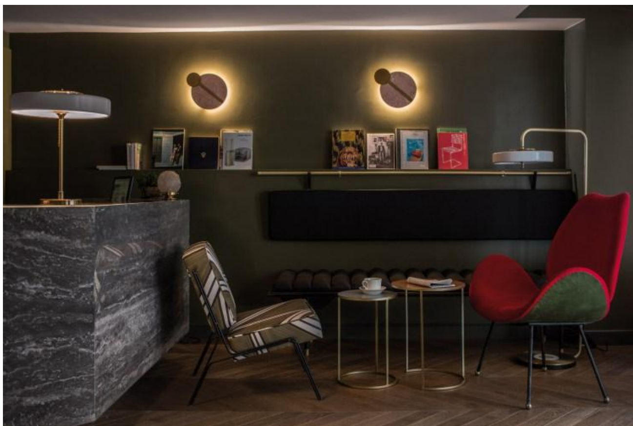
Louvre Piémont, Paris

« Des codes élégants à la hauteur de l'adresse »