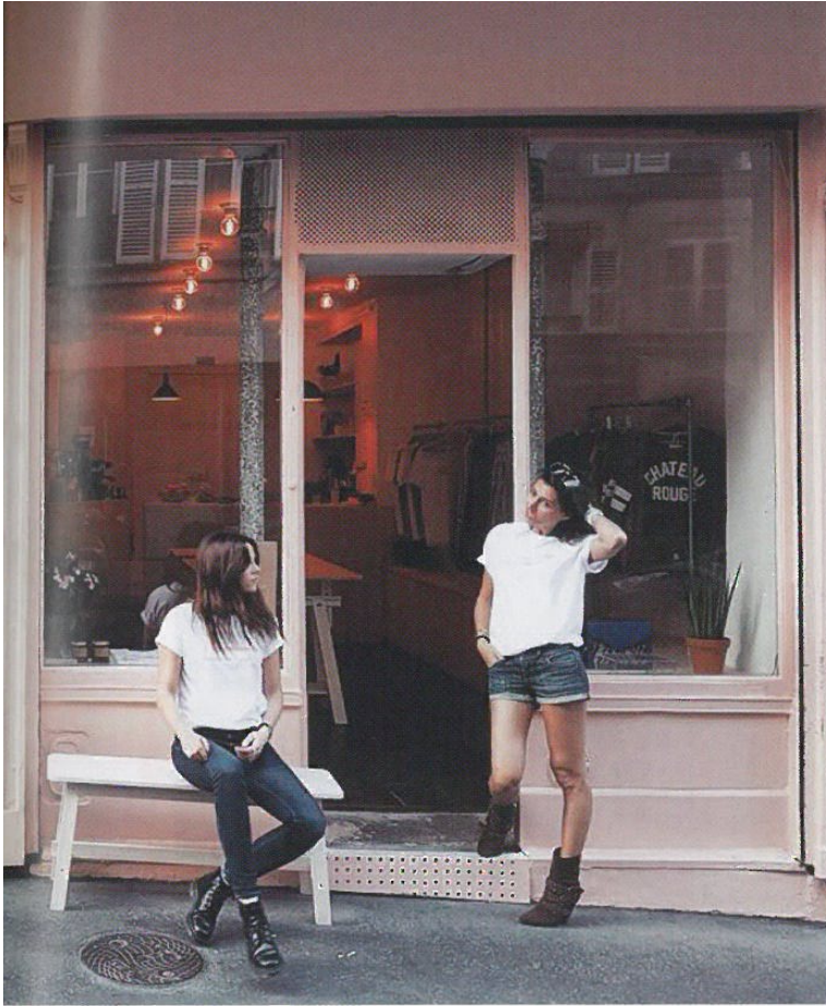
FAR NEARER @FARNEARERPARIS