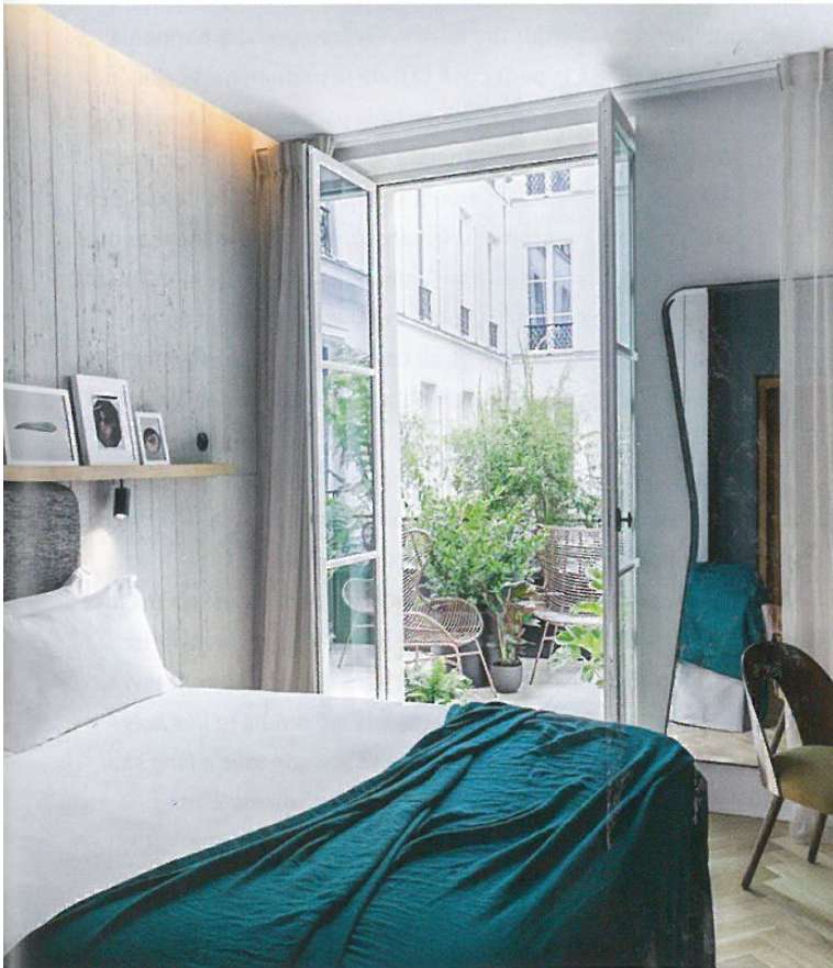
HÔTEL NATIONAL DES ARTS ET MÉTIERS

€ / 48, rue Notre-Dame-de-Lorette, 9 e @farnearerparis