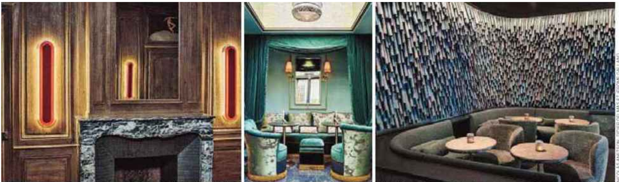
Salon de l'appartement de Coco Chanel, avec l'applique L'Hypocrite de Dorothée Delaye et Daphné Desjeux (1). Hôtel Maison Nabis, par Oscar Lucien (2). Le restaurant de l'Hôtel National des Arts et Métiers, par Raphael Navot (3).